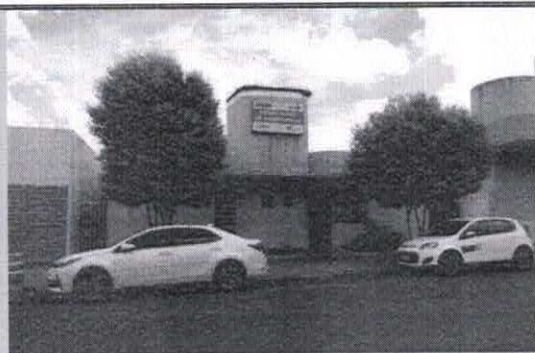
Registro de Localização.